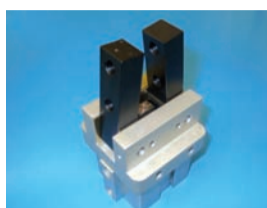
Sonderzylinder – kundenspezifische Konstruktion und Herstellung

Die CMA CNC Mechanik AG, gegründet 2001, ist ein junges, dynamisches und innovatives Familienunternehmen. CMA beschäftigt 25 Fachspezialisten. Das Leistungspaket umfasst die Herstellung von Einzelteilen bis zu Baugruppen und Komponenten. Die CMA-Kunden kommen aus der Messtechnik, dem Maschinen- und Apparatebau, der Kunststoffindustrie, Automobil, Hydraulik und Pneumatik sowie aus der Medizinaltechnik. Mit dem modernsten Maschinenpark und den dazugehörigen Anlagen in klimatisierten Räumen bietet CMA qualitativ hochstehende CNC-Bearbeitung wie Drehen, Fräsen, Rund- und Flachsleifen, Drahterodieren, Honen und Centerless-sleifen an.