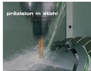
Abb. 3: CMA Altstätten