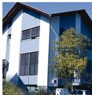
Abb.1: CNC-Mechanik AG - Ideen und Visionen in Altstätten